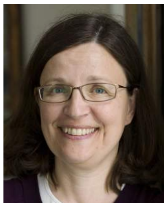
Anna Ekström