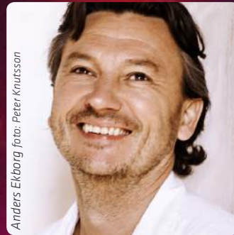
Anders Ekborg